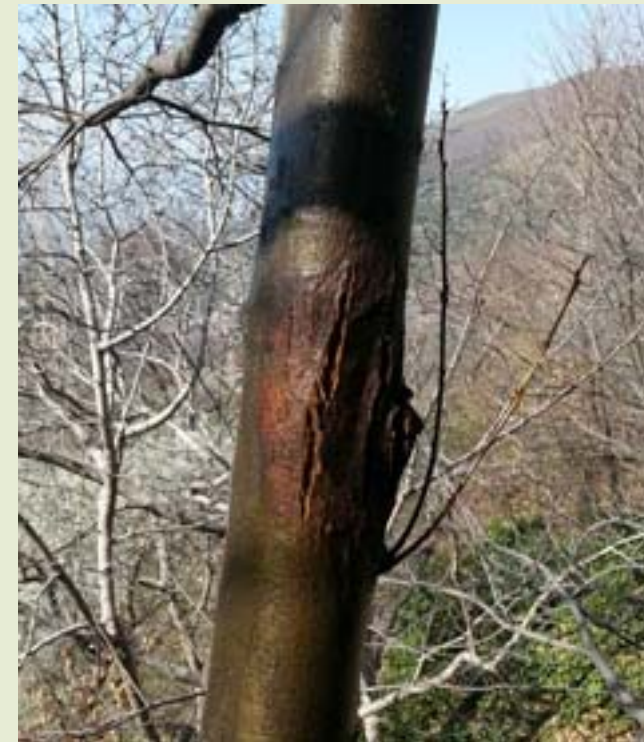
Flavonin® Agro Complete (29.02.2016)

Mit 100 Liter Lösung wurden rund 40 alte Bäume behandelt.