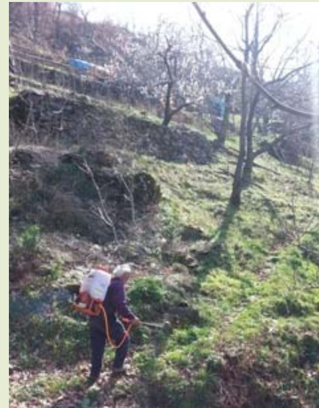
Flavonin® Agro Complete (29.02.2016)

1% (1 lt / 100 lt Wasser) Lösung wird mindestens 3 x hintereinander auf Stamm und Äste tropfnass aufgebracht